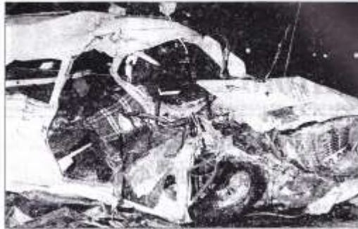
Den norska bilen blev totalt sönderslagen vid kollisionen